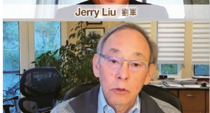
Steven Chu 朱棣文