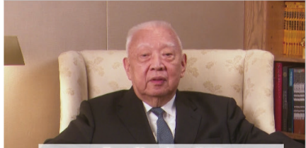
Tung Chee-hwa 董建華