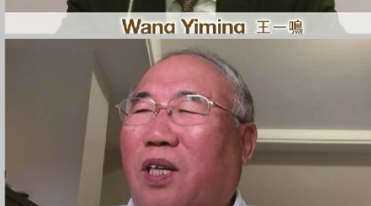
Xie Zhenhua 解振華