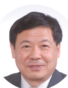
朱光耀 (Zhu Guangyao)

他總結，雖然中美複雜的競爭和博弈仍難避免，中美改善經貿關係仍將迂迴曲折，但有理由期待，只要雙方有意願共同努力，中美能夠重建更加穩定、更具建設性的經貿關係。