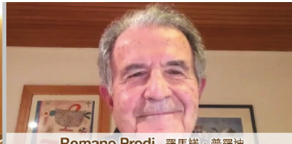
Romano Prodi 羅馬諾·普羅迪 Former Prime Minister of Italy, Former President of the European Commission