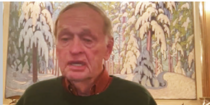
Jean Chretien 讓·克富蒂安