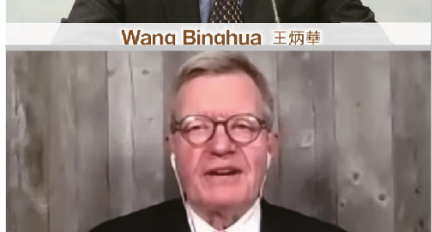
Max Baucus 馬克斯·鮑卡斯