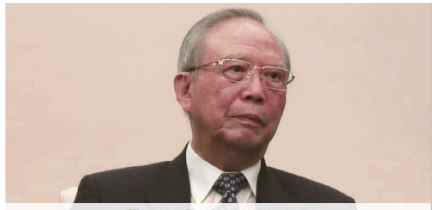
Zeng Peiyan 曾培炎