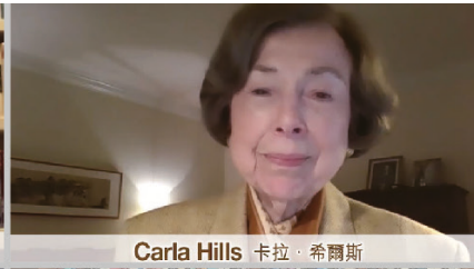
Carla Hills 卡拉·希爾斯