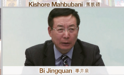
Bi Jingquan 畢井泉