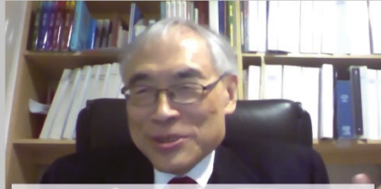
Lawrence Lau 劉遵義