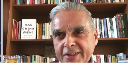
Kishore Mahbubani 馬凱碩