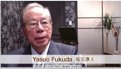
Yasuo Fukuda 福田康夫 Former Prime Minister of Japan