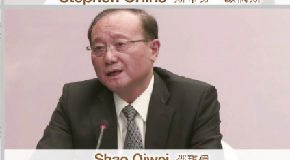
Shao Qiwei 邵琪偉