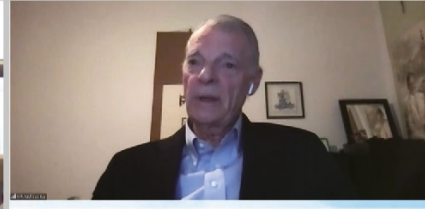
Michael Spence 邁克爾·斯賓塞