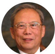
曾培炎 (Zeng Peiyan)